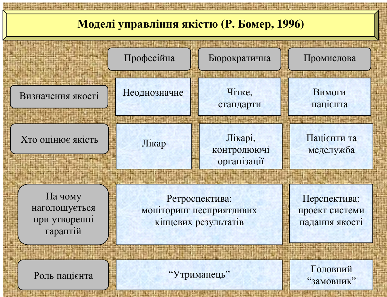
Рис. 3. Моделі управління якістю (Р. Бомер, 1996)

Якість – “ступінь, до якого медичні послуги для окремих осіб та населення взагалі збільшують можливість бажаного результату стосовно здоров'я та є узгодженим із сучасним професійним знанням”.